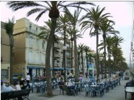
PLACA DE CATALUNYA